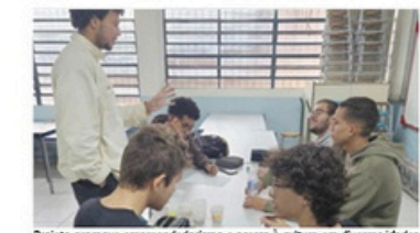
Projeto promove empreendedorismo e acesso à cultura em diversas idades

social. Oferece oficinas de costura e artesanato, para que as atendidas possam ter sua autoestima renovada, gerando o empreendedorismo cultural. Geração Audiovisual: curso de produção para cinema direcionado a alunos da Rede Pública de Ensino. Com ferramentas de mídia aplicadas em cinema, ensina como filmar, atuar e improvisar, auxiliando a perda da timidez, ajudando na aprendizagem e na