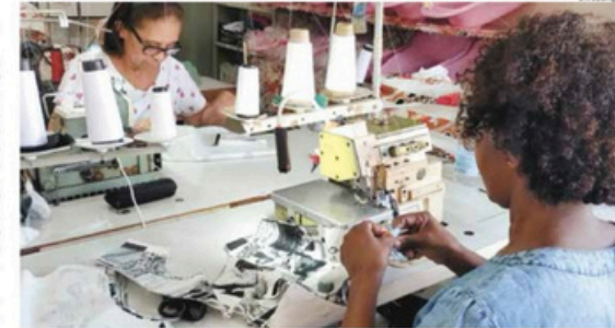
Oficinas gratuitas de Corte e Costura tem o objetivo de empoderar as mulheres da comunidade

estará oferecendo oficinas de costura, Padronagem, Corte de tecido, Costura à mão, Montagem de peças, Acabamento, Ajustes e reparos. As atividades ocorrerão regularmente às Terças, Quartas e Quintas, das 09h às 11h, na Rua José da Silva Maciel, número 1020, no