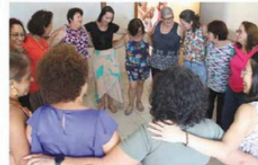
As participantes são mulheres vulneráveis do Jardim Morada do Sol

Conheça mais sobre o Projeto e o Instituto através das redes sociais, no Instagram: @nanquinculturaarte ou pelo telefone (19) 98121-6090.