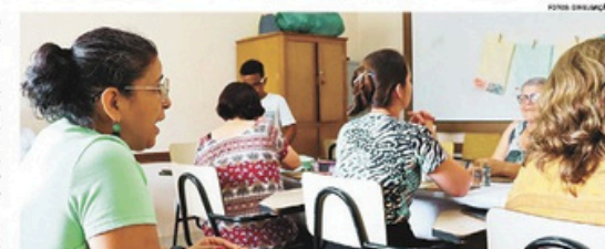
Nanquin desenvolve e executa projetos focados em desenvolvimento sustentável e inclusão sociocultural

liando a desenvolverem e executarem a sua arte, através de propostas incentivadas. Hoje, a Nanquin desenvolve e executa projetos focados em diferentes objetivos de desenvolvimento sustentável e inclusão sociocultural, atendendo diversas faixas etárias e gêneros, promovendo o empreendedorismo e acesso à arte e cultura. Tear dos Saberes: projeto oferecido para mulheres de 16 a 60 anos vítimas de violências e em vulnerabilidade