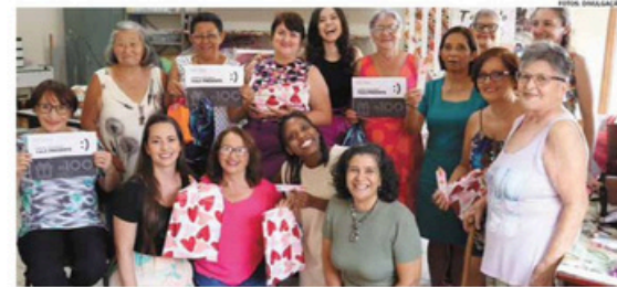
A Ação aconteceu na segunda-feira (11) e fez parte do calendário de Eventos do Instituto

A ação contou com um dia de beleza, com corte, escova, massagem e palestras sobre autoestima